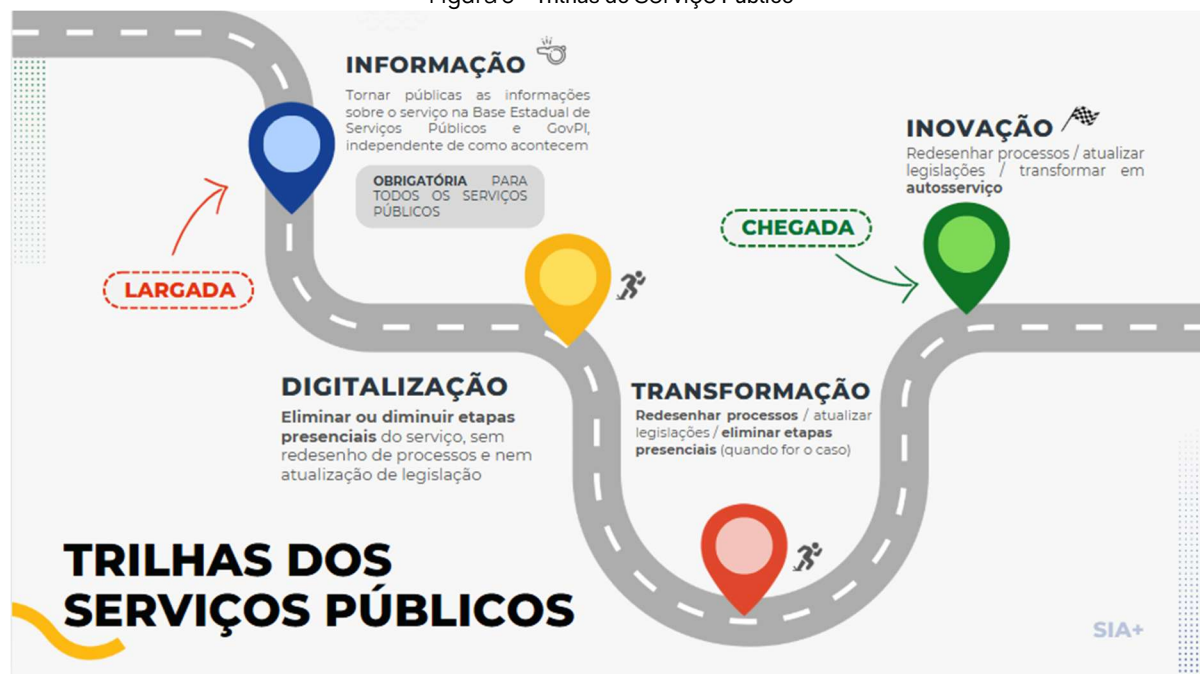
Figura 3 - Trilhas do Serviço Público

As trilhas dos serviços públicos são um caminho estratégico para modernizar o atendimento ao cidadão, guiando os órgãos desde a oferta de informações até o autosserviço digital. O objetivo é elevar a maturidade dos serviços, com mais eficiência, menos burocracia, maior acessibilidade e qualidade no atendimento.